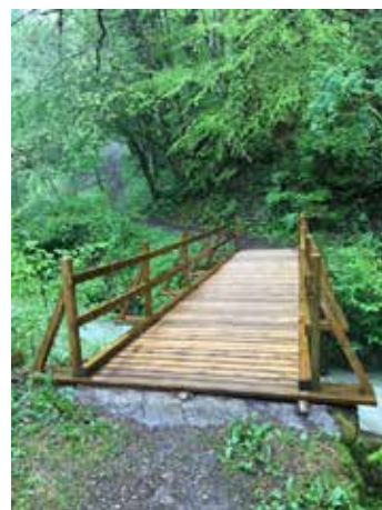
Passerelle sur la Vence