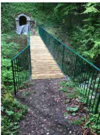
Passerelle des Brieux