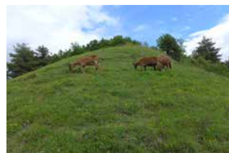
Après : coteau préservé grâce au pâturage