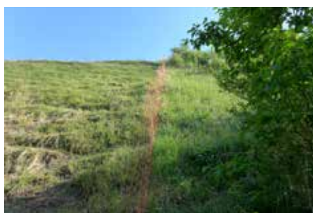
Travaux de débroussaillage et pose de clôtures