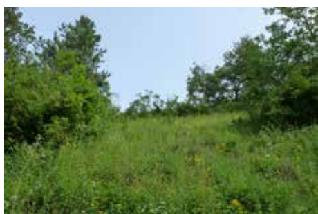
Avant : coteau enfriché