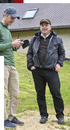
Interview du directeur de course par le correspondant du Dauphiné Libéré