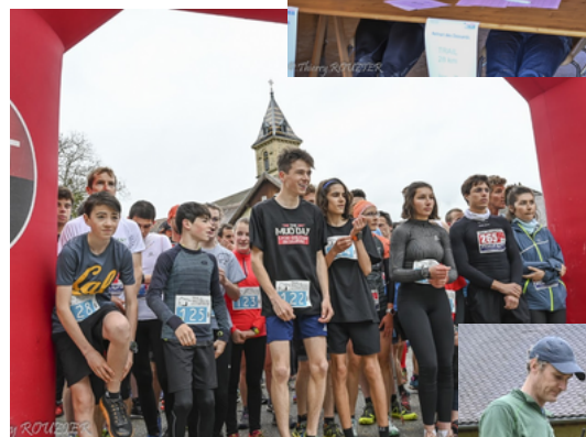
Départ du 5 km en 2019